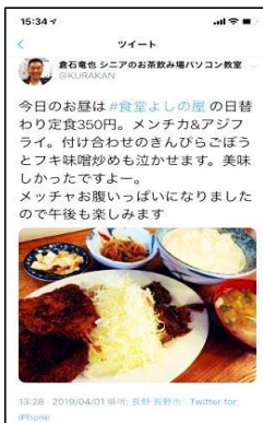
こんな感じに 発信してます